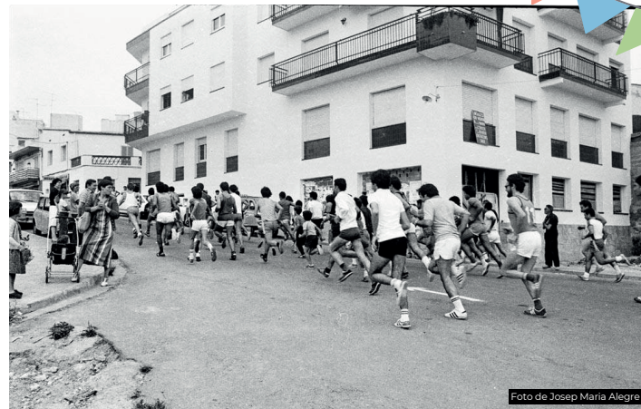
Cursa d'atletisme al Camí de la Fita realitzada durant les Festes del Poble Sec del 1979.