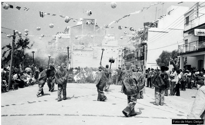
Exhibició del ball de diables realitzada durant les Festes del Poble Sec del 1979.

Audició de sardanes a càrrec de La Coblà Sitgetana .